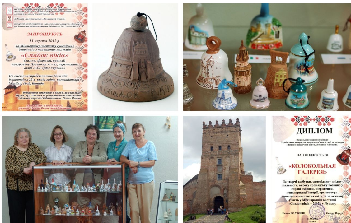
Рис. 11. Виставка «Наследие веков». Украина, Луцк.

В 2014 году участники «Колокольной галереи» представили колокольчики: