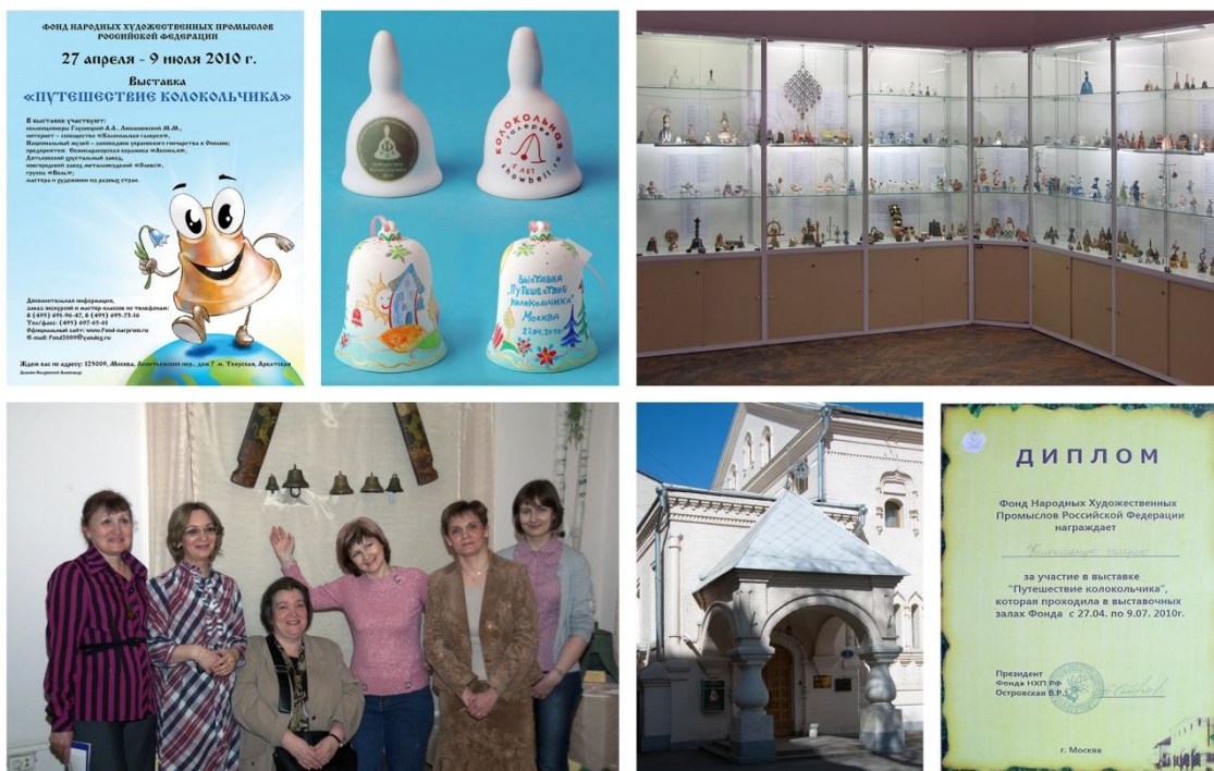
Рис. 10. Выставка «Путешествие колокольчика». Москва.

В 2011 году прошли еще три выставки, организатором и участником которых была «Галерея»: