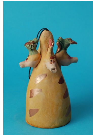
Рис. 3. Колокольчик со свистульками в стиле романовской глиняной игрушки. Автор О. Волокитина.