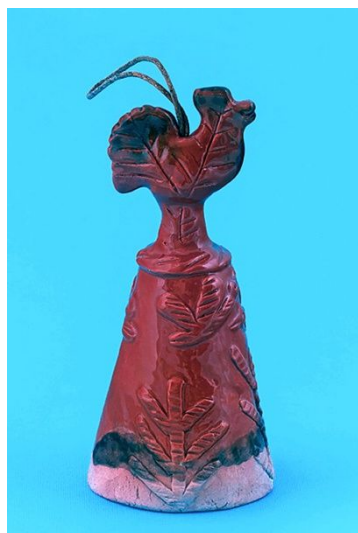
Рис. 8. Колокольчик «Петушок» в стиле федоровской глиняной игрушки.

Автор росписи А. Соколова, автор формы В. Табунов.