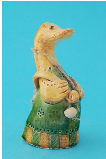
Рис. 2. Колокольчик «Уточка» в традициях петровской глиняной игрушки. Автор С. Пиманова.