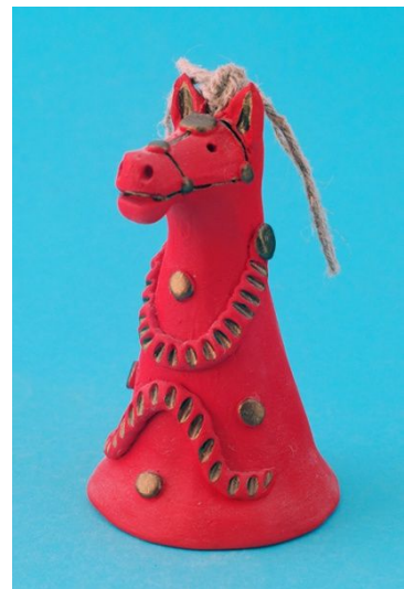
Рис. 6. Колокольчик «Конь» в стиле абашевской глиняной игрушки. Автор Н. Югалдина.