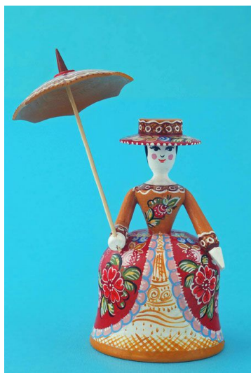
Рис. 7. Колокольчик «Барыня» с городецкой росписью.