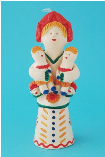
Рис. 1. Колокольчик «Барыня» в стиле хлудневской глиняной игрушки. Автор А. Заборских.