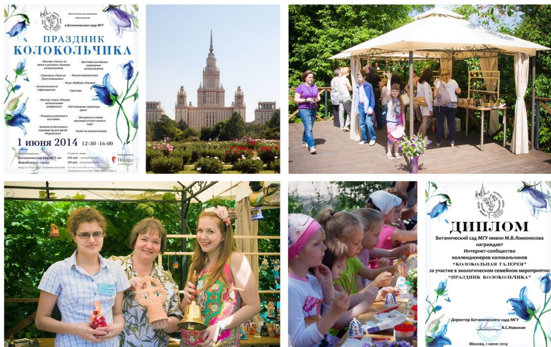
Рис. 12. Праздник колокольчика в МГУ на Воробьевых горах. Москва.

другие мероприятия на колокольную тему. «Галерея» расположилась на палубе возле живописного пруда. Каждому участнику предоставили специально изготовленные звонницы, установленные на столе. Гости брали колокольчики в руки, разглядывали, звонили, радовались.