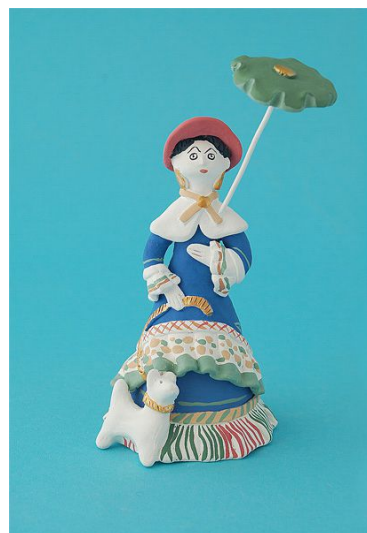
Рис. 9. Колокольчик «Барыня» в стиле тульской городской игрушки.