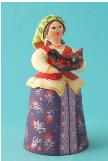
Рис. 4. Колокольчик «Барышня с ковшом» в стиле ковровской глиняной игрушки. Автор Н. Куприна.